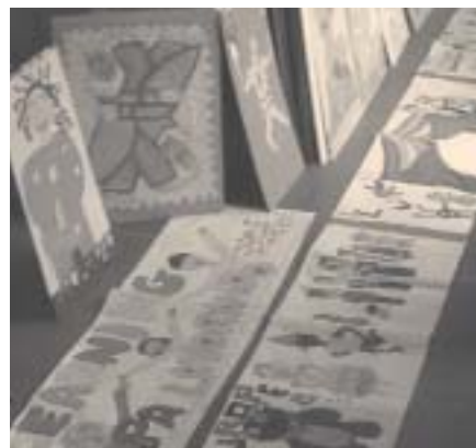
Lavori creativi degli studenti

Responsabile dell'Ufficio Europa del Comune di Ravenna