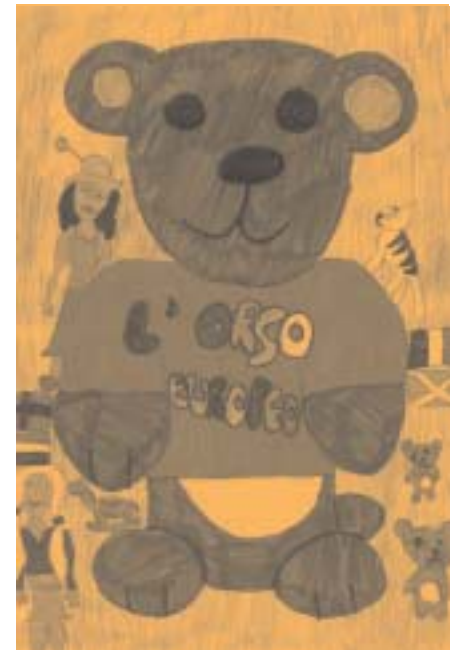
Un disegno di un'alunna della Scuola Elementare Garibaldi di Ravenna - classe V.

"(...) Il Capo dello Stato desidera farLe giungere il ringraziamento ed il suo apprezzamento per questa delicata e apprezzabilissima favola, in cui il Suo spirito europeista si traduce in lieve poesia per le giovanissime generazioni. Riceva dal Presidente Ciampi i più cordiali saluti".