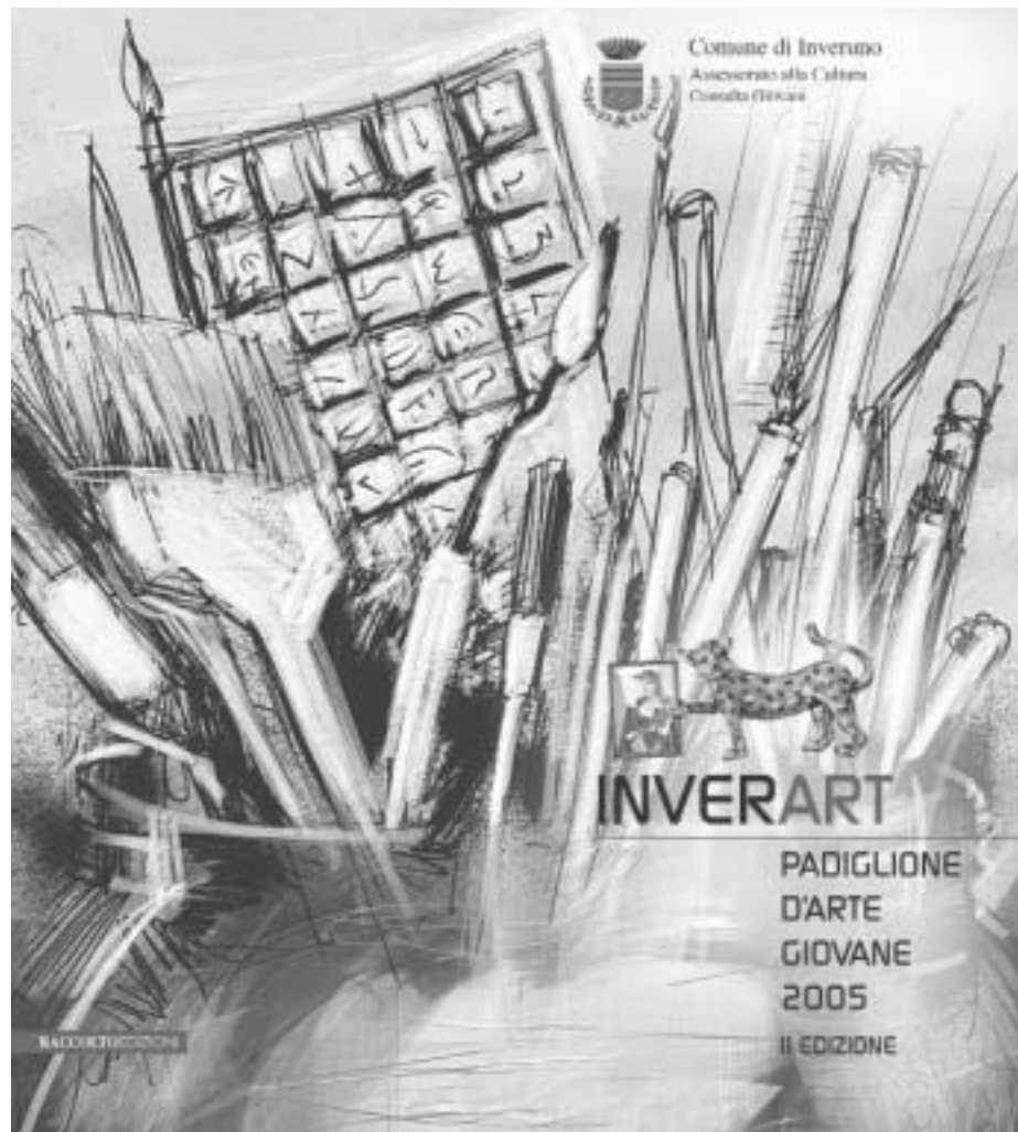
La copertina del catalogo 2005 con un'illustrazione di Armando Mascetti.