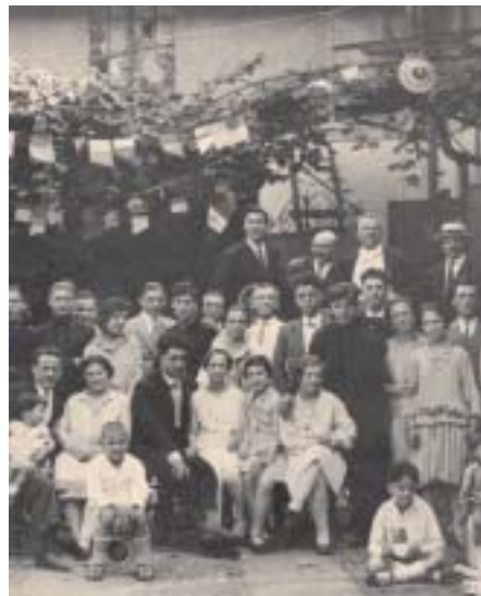
Anni '10: Società Proletaria Escursionisti Milanesi, sezione di Dergano. Dal volume "Affori & Uniti va in città" (Raccolto, 2005)

stessi diritti di voto (una testa, un voto) e nessuno accumula utili di arricchimento, mentre tutti concorrono a costruire e incrementare il fondo economico sociale.