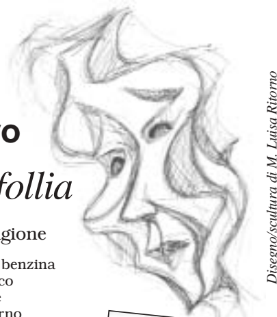
Disegno/scultura di M. Luisa Ritorno

15x21 cm. 150 pagg. Raccolto, 2005 15,00 euro per work-out euro 10,00