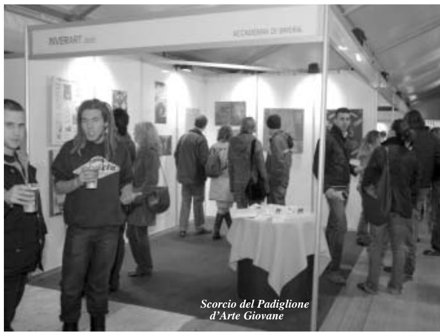
Scorcio del Padiglione d'Arte Giovane

È quindi a cuore aperto che accolgo l'invito dell'Assessorato alla Cultura di Inveruno di allestire all'interno di questa kermesse uno spazio con le opere di alcuni miei allievi del Dipartimento di Arti e Antropologia del Sacro dell'Accademia di Belle Arti di Brera. Mi trovo così a fare da padrino ad una manifestazione cui partecipano alcune decine di giovani talenti in formazione dalla quale sicuramente, come la cittadinanza tutta che interverrà, avrò molto da imparare. Devo sottolineare che la voglia di conoscere e sapere quanto accade intorno al pensare e al fare artistico è insita in me. Sì,