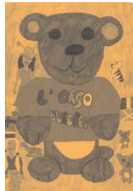
Un disegno di un'alunna della Scuola Elementare Garibaldi di Ravenna - classe V.

"(...) Il Capo dello Stato desidera farLe giungere il ringraziamento ed il suo apprezzamento per questa delicata e apprezzabilissima favola, in cui il Suo spirito europeista si traduce in lieve poesia per le giovanissime generazioni. Riceva dal Presidente Ciampi i più cordiali saluti".