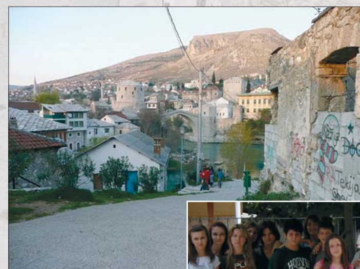
La città di Mostar. Sotto, alcuni ragazzi delle scuole della città. In basso a sinistra, gruppo di lavoro del Comune di Ravenna e dell'ADL Mostar.

in Bosnia nuovi amici per l'Orso europeo, L'Agencia della Democrazia Locale di Mostar: